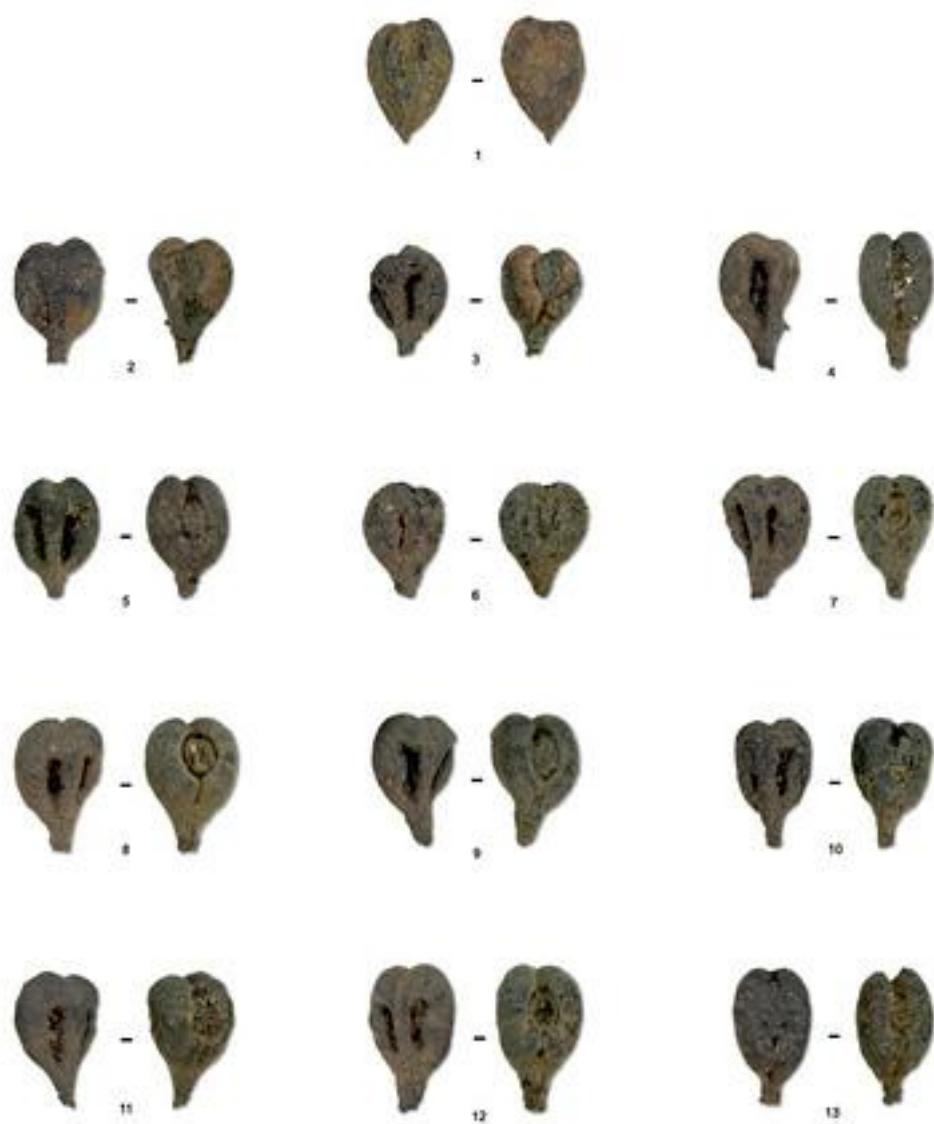
0 0.2 0.4 mm Areni-1 cave. 2007 excavations. 1-13. Grape seeds